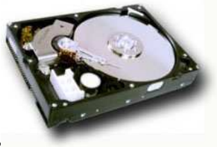
Hard disk esterno